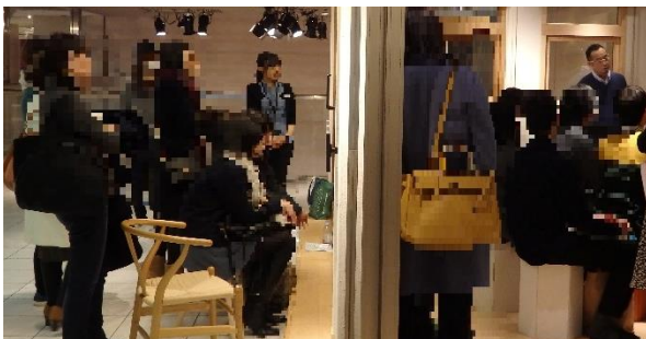
下:沢山の方にご参加頂き、立ち見が出る程の盛況ぶりでした

セミナー後半はショールームに展示されているアイランドキッチンを囲んで参加者の方にキッチンの使用感を体感して頂きました。